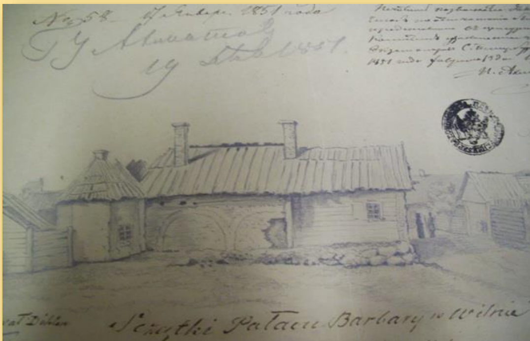
Butvilovskis. Barboros Radvilaitės rūmų Vilniuje liekanos. Litografija. 1850 m.