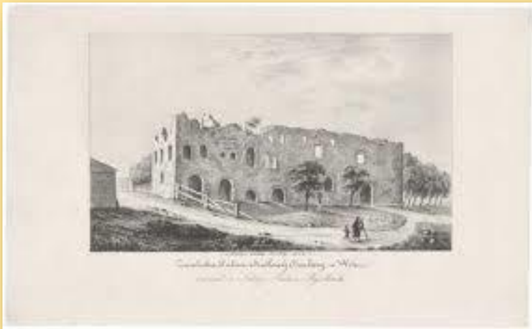
T. Bičkauskas. Radvilų rūmų Puškarnioje griuvėsiai. Litografija. 1828 m.