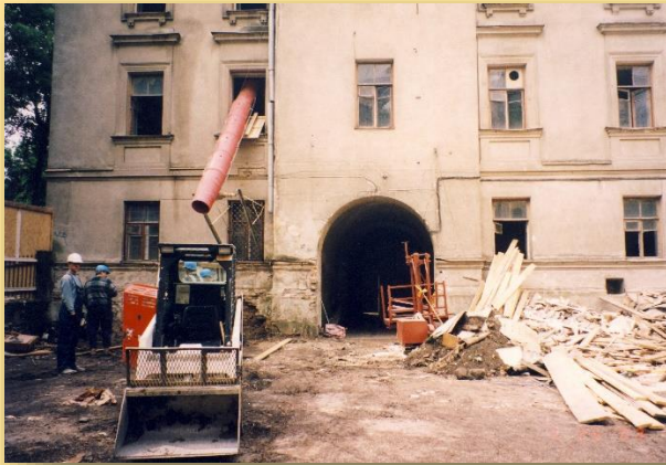
Teismo pastato Žygimantų g. 2 rekonstrukcija 2003 m.