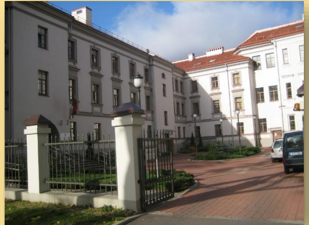
Teismo pastatas 2005 m.

Vienas iš ligoninei priklausančių pastatų, daugelį metų nenaudotas, kiauru stogu, užverstas XX a. šiukšlėmis, 2003–2004 m. buvo rekonstruotas ir pritaikytas Vilniaus apygardos administraciniam teismui, kuris čia ir veikia nuo 2004 m.